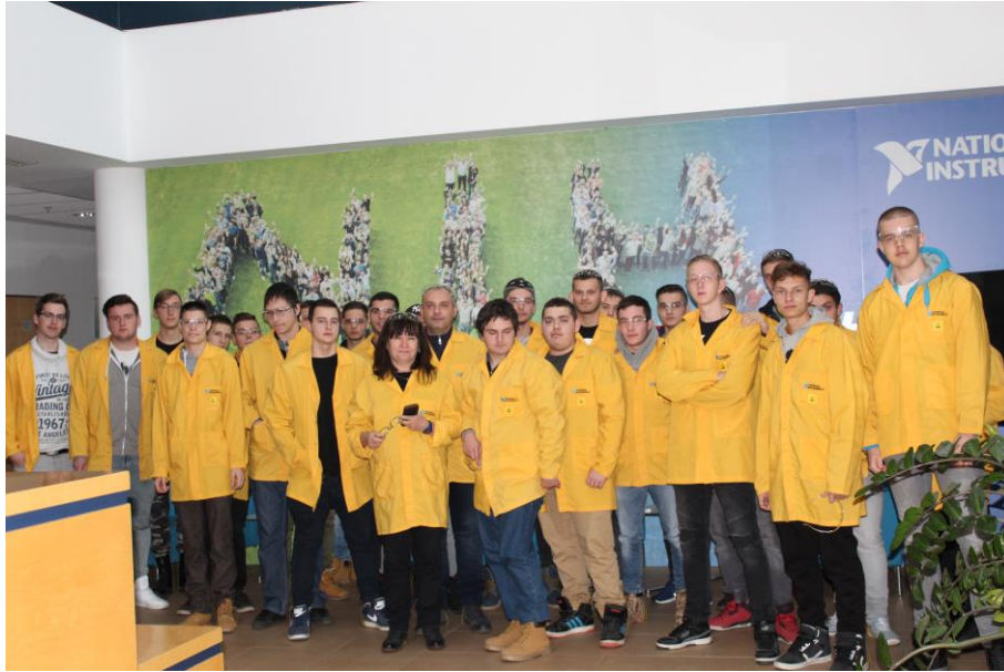
Gyárlátogatás a National Instruments-ben